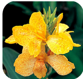
1CAN604 เยลโลว์ (Yellow)