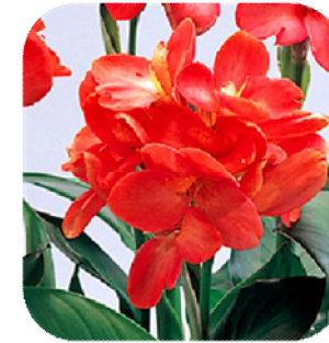
1CAN603 แซลมอน (Salmon)