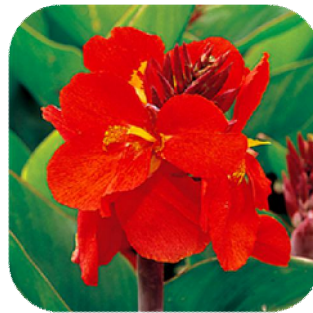
1CAN602 เรด (Red)