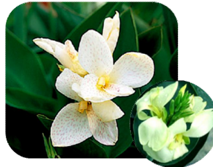
1CAN605 ไวท์ (White)